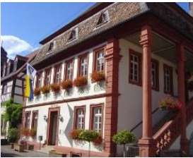
Station 1: Einführung in den Rundgang