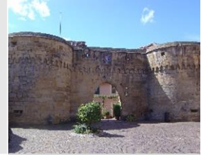
Station 5: Inneres Tor Station 6: Eisentor