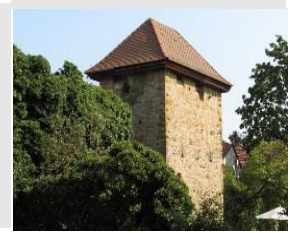
Station 10: Diebesturm