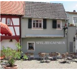
Station 13: Spielzeugmuseum