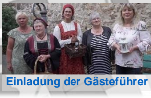
Einladung der Gästeführer