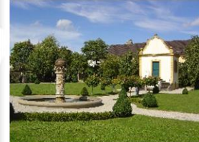
Station 7: Barockgarten und Hahnenturm