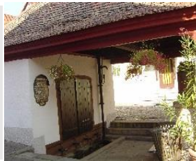
Station 12: Platz an der Bach / 4 Röhren-Brunnen