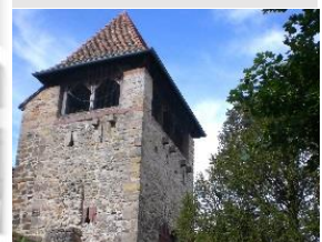
Station 9: Casinoturm