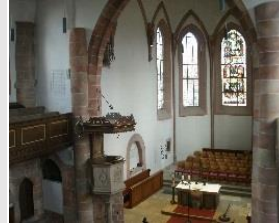
Station 3: Prot. Kirche