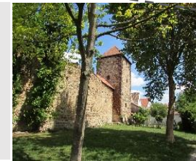
Station 11: Herzogturm