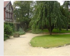
Station 4: Retzerhaus und Retzerpark